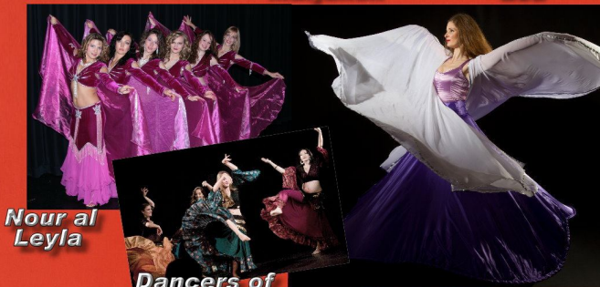
Nour al Leyla